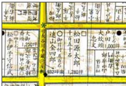
中央：旧長谷川平蔵屋敷とある（遠山金四郎） 左：役宅イメージ 右：人足寄場・石川島