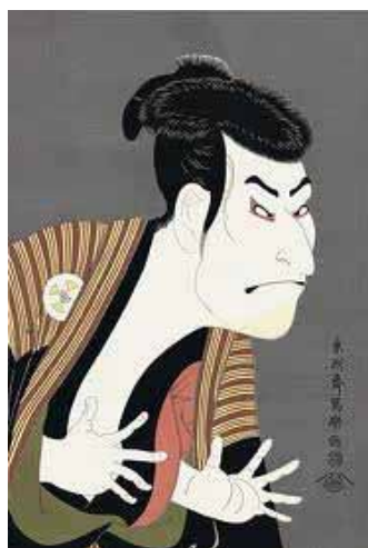
(東洲斎写楽・浮世絵)