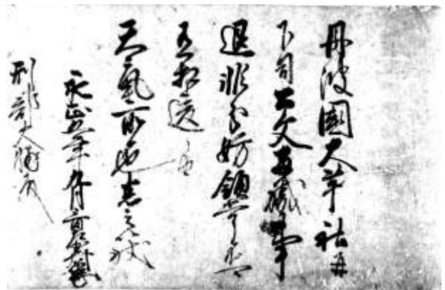
後柏原天皇綸旨 (東京国立博物館蔵)