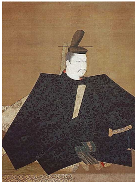
伝 源 頼朝像(神護寺)

『吾妻鏡』は、鎌倉幕府を研究する際の基本史料です。だが同史料は北条氏による編纂物であり、正確な史実を捉える上では、同時代に記された諸史料を参照する必要があります。