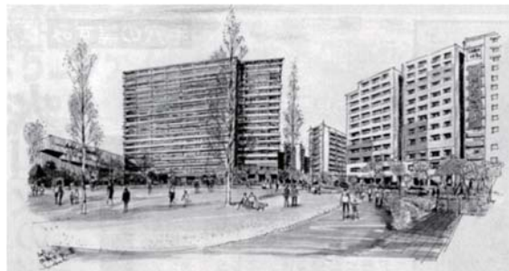
西新井さかえ公園 画 大淵澄夫