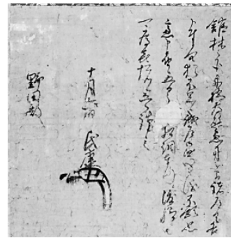
北条氏康書状 (東京国立博物館所蔵) (北条氏が館林攻略に利根川渡河の材料調達を依頼した手紙)